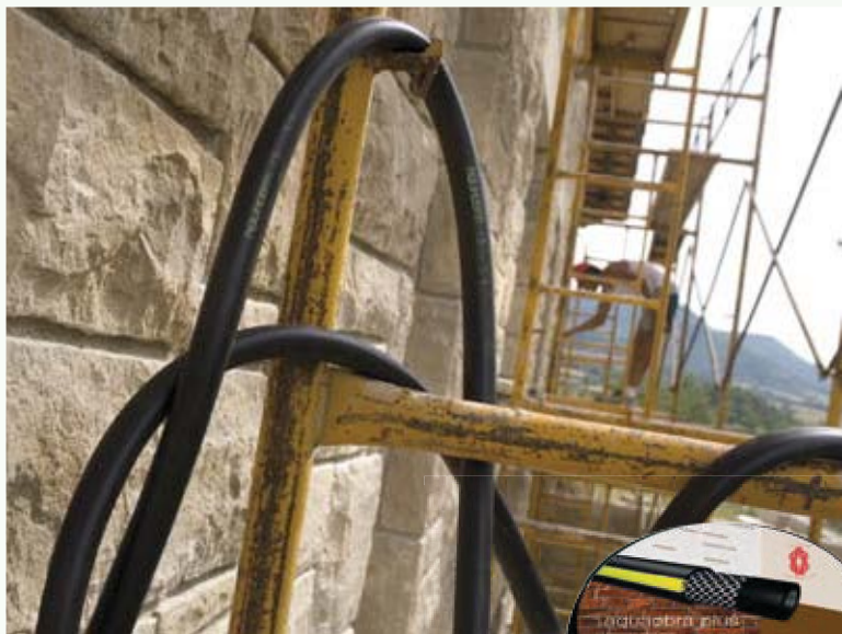
Rollo 50 m

En función de las evoluciones técnicas, las especificaciones pueden ser modificadas sin previo aviso. Otros diámetros, colores y características previa consulta.