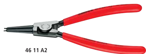
46 11 A2