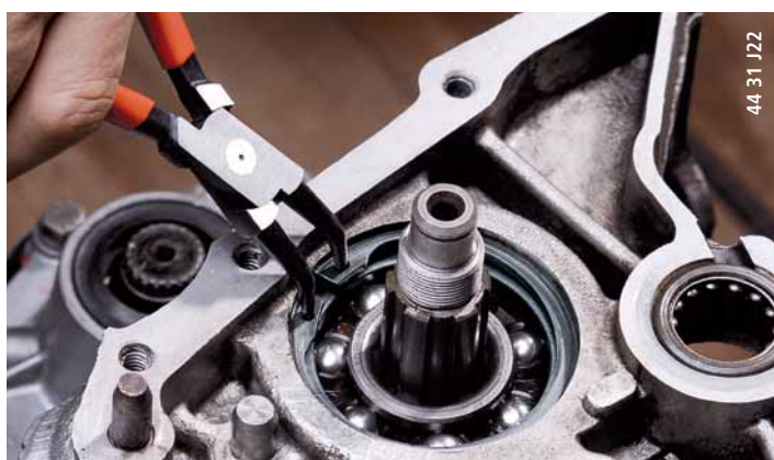
44 31 J22