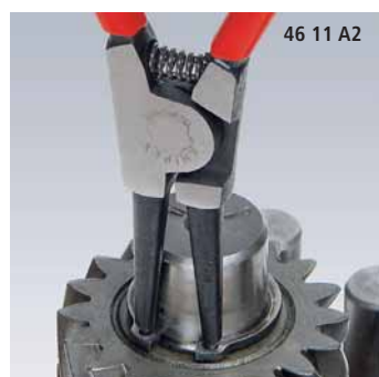
46 11 A2