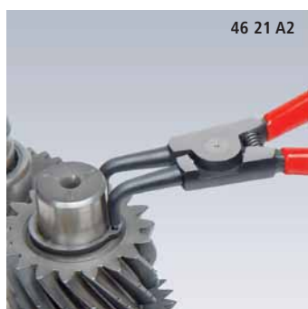
46 21 A2