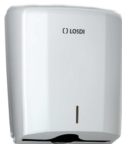
REF: CP-0106-B Acabado BLANCO