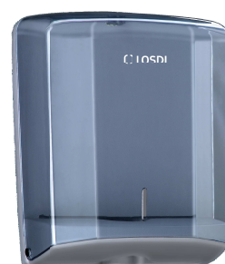
REF: CP-0106 Acabado FUMÉ