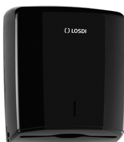
REF: CP-0106C-BL Acabado NEGRO