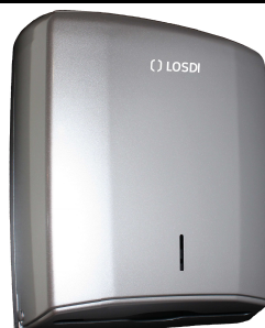
REF: CP-0106-CG Acabado PLATA