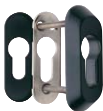
Detalle del escudo E210