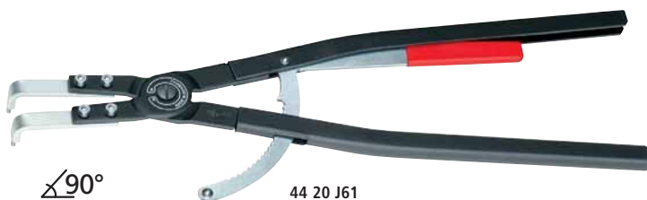
44 20 J61