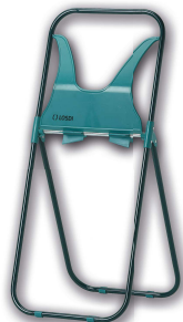
REF: CP-0524 Acabado GALVANIZADO Y LACADO EPOXY