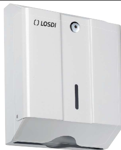
REF: CP-0105 Acabado EPOXY BLANCO