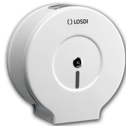
REF: CP-0203 Acabado EPOXY BLANCO