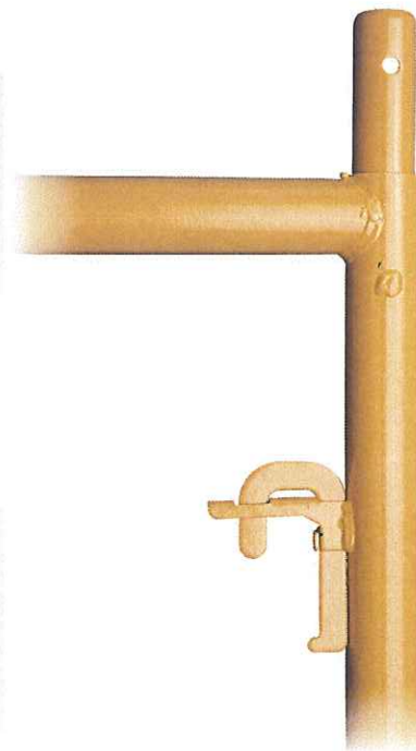
Soldadura del montante con los horizontales en el modelo reforzado

Y para que así conste, lo firmo en Íscar, a dos de octubre de 2009.