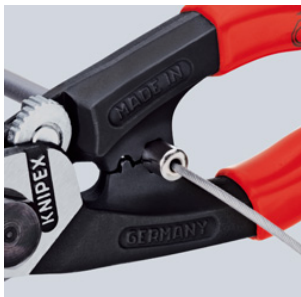
Prensar los terminales a la funda Bowden