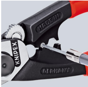
Prensar el terminal al cable de tracción