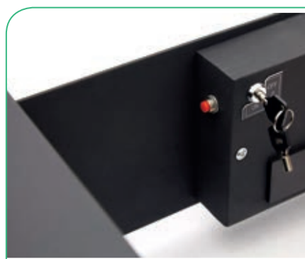
Opción llave de alquiler en Refs. 19000-S3 y 19000-S4.