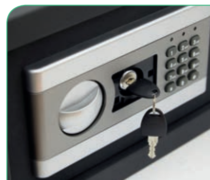
Dispone de llave de emergencia tubular para su uso en caso de olvido del código secreto.