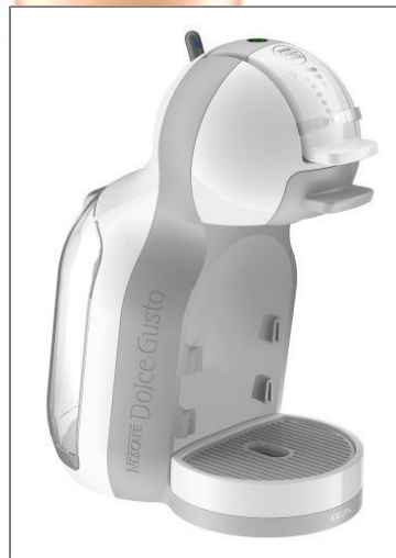
MINI ME BLANCA Máquina de cápsulas multibebidas KP120110

Con su diseño compacto, Mini Me es una pequeña cafetera inteligente que se adapta a cualquier cocina.