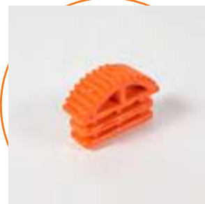
ACCONTELINT Contera interna