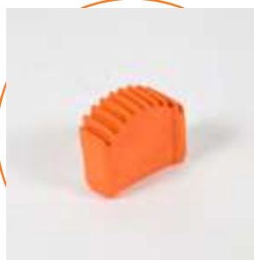
ACCONTELES Contera exterior