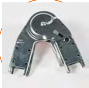
ACCARLIG44 Carcasa 4+4