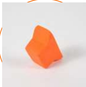
ACEPELPRO Embellecedor peldaño