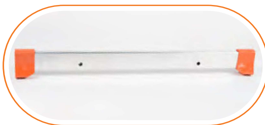
ACESTA 100 Estabilizador de 100 cm