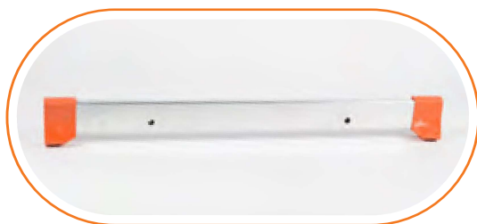
ACESTA 88 Estabilizador de 88 cm