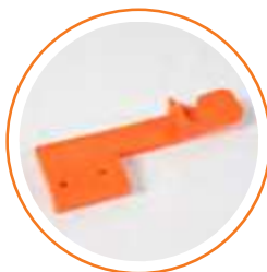
ACGATSEBAS Gatillo seguridad naranja