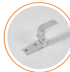
ACGGATSEBAS Gancho gatillo seguridad