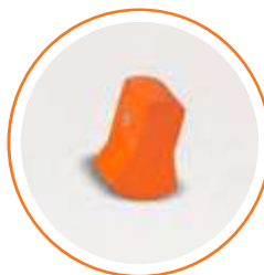
ACCONBASEFIR Contera base naranja