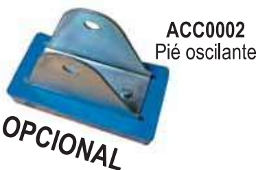
ACC0002 Pié oscilante