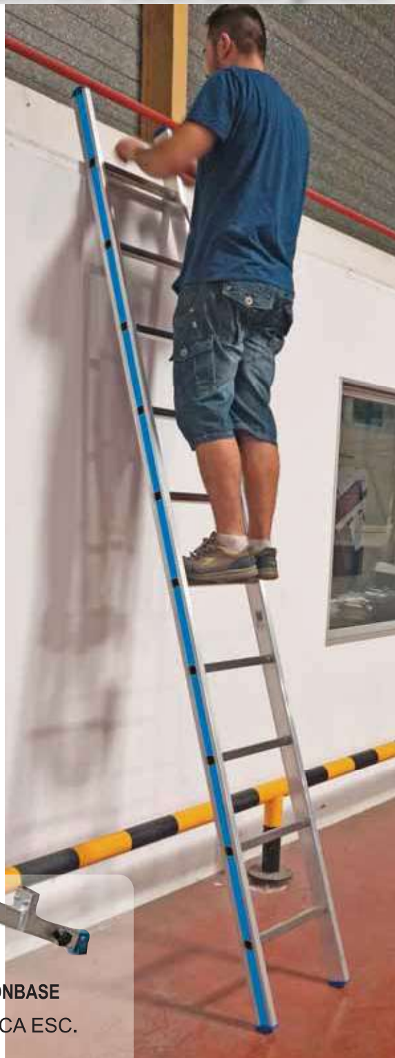
ACBASF95/2 BASE TELESCOPICA ESC. CUERDA 2 TRAMOS PERFIL 95.