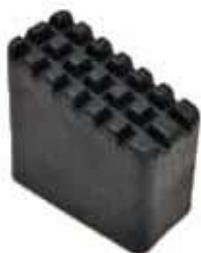
ACCONMA - 4€ PVP

Especial para pintores y electricistas, de uso exclusivo en tijera y de doble subida. Con peldaños anchos, de 8 cm., y montantes de sección piramidal sobre su anchura total, alargada progresivamente de arriba hacia la base. En la parte superior, además del sistema anti apertura, los peldaños conforman un tipo de estructura para acoger todo tipo de materiales y recipientes. Para asegurarse, de la estabilidad de la escalera, se equipa con tacos de goma antideslizantes y cinta anti-apertura a partir de 8 peldaños.