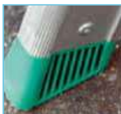
ACCONDS / 14D

Las cintas anti apertura son más resistentes y amplias.