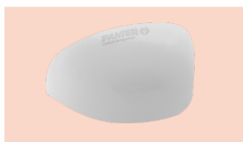
PUNTERA PLÁSTICA Anti-impactos 200J