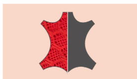
TEXTIL TÉCNICO + POLIURETANO