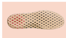
PLANTILLA TRI-TEC Viscoelástica Antibacteriana

Tel: (+34) 965 310 613 Fax: (+34) 965 312 185