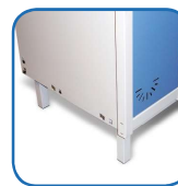
Patas de acero