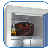
Balda Galvanizada Con orificios para perchas