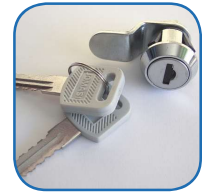
Cerradura de cilindro (2 llaves)