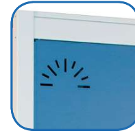
Rosetas de ventilación

Puerta RAL 5014 Azul Cuerpo RAL 7035 Gris Pintura epoxi-poliéster microtexturada