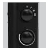
Termostato regulable y selector de potencia

Ambos modelos se pueden instalar en la pared.