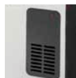
Salida de aire forzado TLS-503T