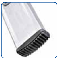
Sabots large contact au sol et antidérapants