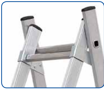
Articulation en acier électrozingué renforcée