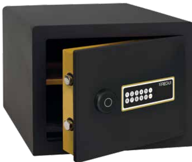
AWA Ref. 220750